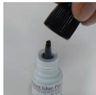
(図2) 勝手に溢れ出すグルー