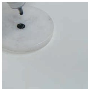
(図1) 容器からグルーを出す

施術のとき、トレーにグルーを出す為に容器の先端「※以下ノズルと呼びます」を下に向けて出します。(図1参照)その後、キャップをする為に今度はノズルを上に向けます。そうすると、容器の中のグルーがノズルから溢れ出てしまうことがあります。(図2参照)自分ではノズルに付いたグルーをキレイに拭き取ってキャップを閉めたと思っても、グルーが溢れ出てしまうことで次に使う時にキャップが開かなかったり、容器の中のグルー自体が固まってしまい、まだたくさん残っているのにいつの間にか使えなくなる。といったことになってしまいます。