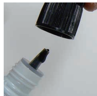
(図3) 容器から溢れ出るグルー

グルーを容器から出した後、ノズルからグルーが溢れ出ているにも関わらずすぐにキャップを閉めないこと！(図3参照)※容器を斜め45度に傾けながら、グルーが溢れ出てこなくなるまで我慢してください。