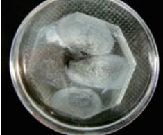
背景を黒くして、白化している状態を見やすくした画像