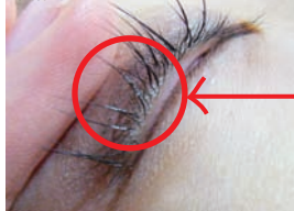
◆白化した状態の観察画像