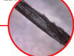
◆白化した状態の観察拡大画像