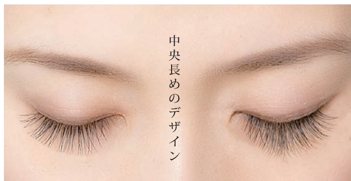
中央長めのデザイン