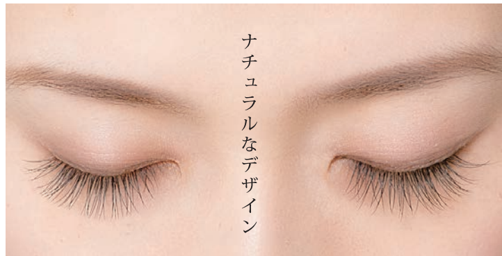
ナチュラルなデザイン