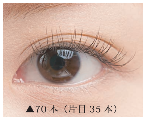
▲70本 (片目 35本)