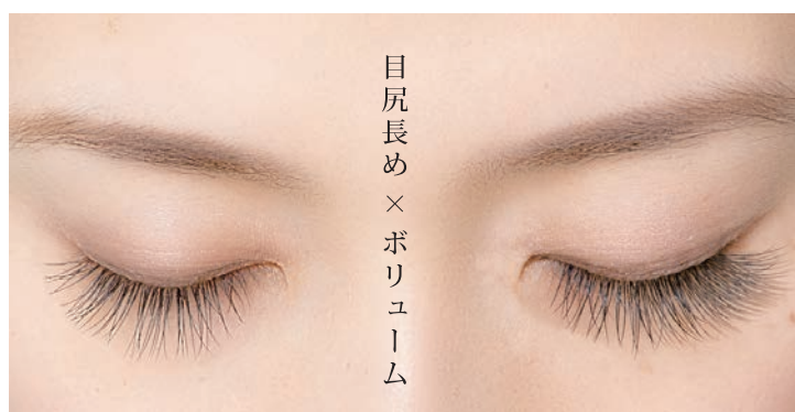
目尻長め×ボリューム