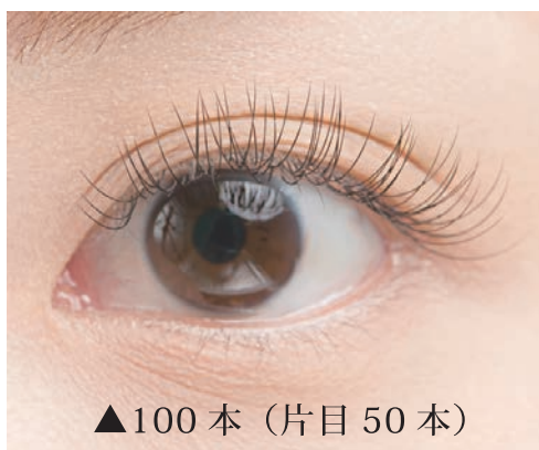
▲100本 (片目 50本)