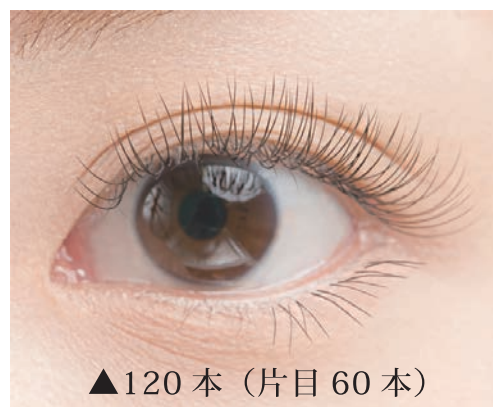
▲120本 (片目 60本)