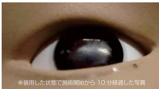
※装着した状態で施術開始から 10 分経過した写真